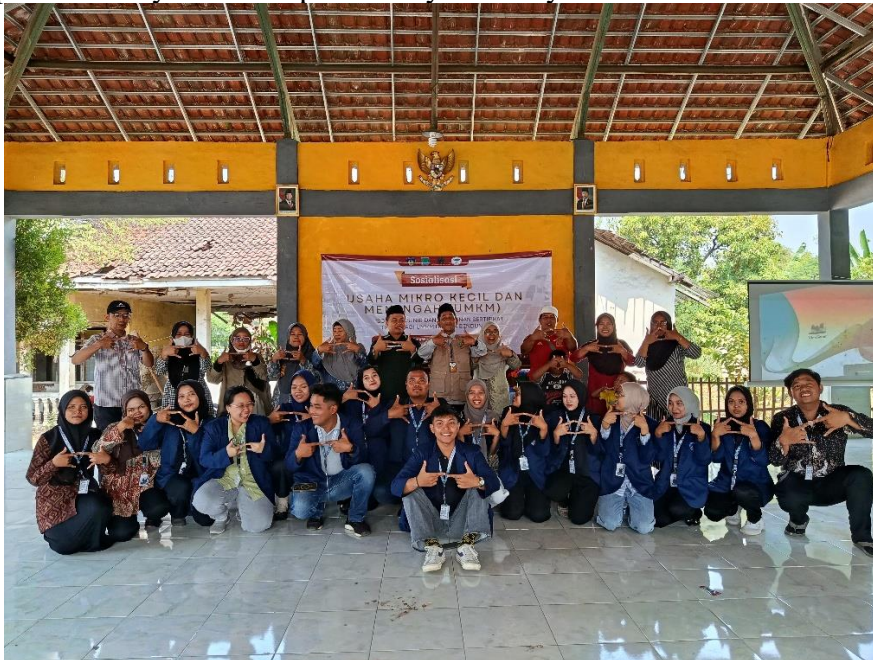
Gambar 2. Sesi Foto Bersama

Selain itu, sinergi yang terbentuk juga menumbuhkan rasa kepercayaan diri dan semangat baru bagi para pelaku UMKM. Mereka merasa lebih diperhatikan karena adanya keterlibatan banyak pihak yang peduli terhadap perkembangan usahanya. Dampak positif ini terlihat dari antusiasme peserta yang semakin tinggi dalam mengikuti setiap sesi sosialisasi, bahkan beberapa di antaranya langsung menunjukkan inisiatif untuk mulai mengurus legalitas usaha maupun sertifikasi halal. Hal ini menjadi bukti bahwa kerja sama multipihak mampu melahirkan perubahan nyata dalam pemberdayaan masyarakat desa.