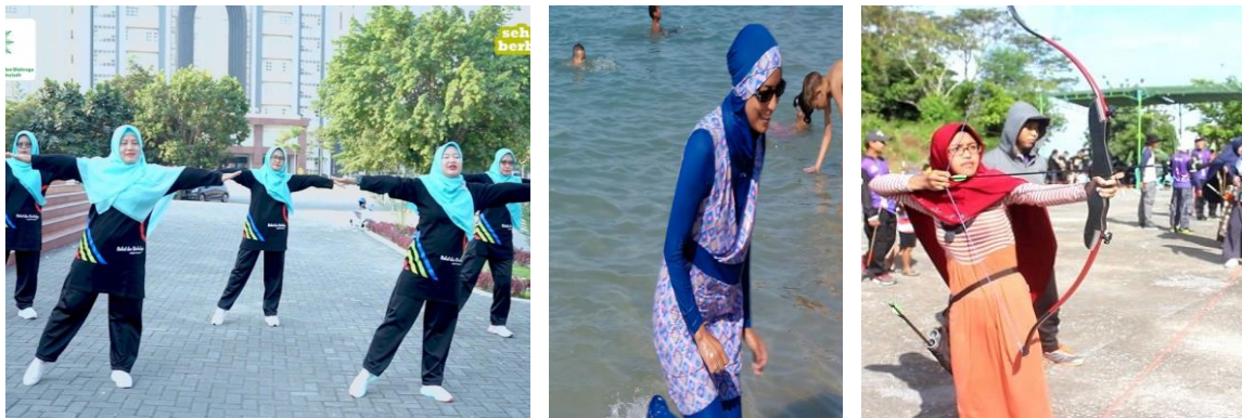
Gambar 3. Alternatif Beberapa Pakaian Olahraga bagi Muslimah

Pelaksanaan pertemuan kedua pemateri menyampaikan tentang manfaat olahraga dan pemilihan pakaian olahraga sesuai syariat Islam. Olahraga memiliki manfaat untuk menjaga dan meningkatkan kesehatan dan kebugaran tubuh manusia baik laki-laki maupun perempuan (Azkia & Apriati, 2022). Rasulullah SAW bahkan sangat menganjurkan umatnya untuk melakukan olah raga seperti berkuda, memanah, berenang dan lari (Hafiz dkk., 2024). Bagi wanita muslim pemilihan pakaian menjadi salah satu hal penting untuk diperhatikan dan hendaknya masih tetap sesuai dengan ketentuan agama yaitu menutup aurat, tidak ketat, tidak tipis atau transparan, dan nyaman dikenakan (Said dkk., 2023). Misalnya dalam aktivitas olahraga renang, senam, jogging atau lari, dan panahan dapat dipilih model pakaian olahraga seperti pada gambar 2.