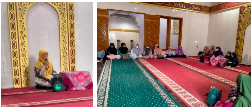
Gambar 2. Penyampaian edukasi pada mitra

Pengabdian masyarakat dilakukan dengan pemberian edukasi tentang berhijab dalam aktivitas olahraga, dilaksanakan pada Anggota Nasyiatul 'Aisyiyah cabang Pekajangan, Kecamatan kedungwuni, Kabupaten Pekalongan. Pengabdian dilakukan oleh tim yang terdiri dari dosen dan mahasiswa dari lintas Prodi pada Fakultas Ilmu Kesehatan Universitas Muhammadiyah Pekajangan Pekalongan. Materi yang disampaikan terdiri dari: hijab dalam Islam, manfaat olahraga dan pemilihan pakaian olahraga sesuai syariat Islam. Pelaksanaan pengabdian dilakukan sebanyak 2 kali pertemuan yaitu tanggal 24 Mei dan 22 Juli, dengan tujuan meningkatkan pengetahuan, pemahaman dan kesadaran untuk berhijab bagi wanita muslimah saat beraktivitas olahraga. Pada pertemuan pertama diawali dengan pembukaan dan pengenalan program dengan menjelaskan tujuan dan manfaat program, serta perkenalan pemateri kepada peserta kegiatan dan melakukan pre test secara tertulis melalui soal pilihan ganda dan kuesioner.